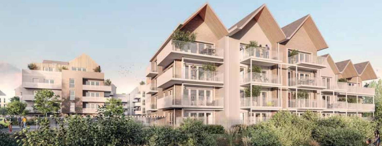
Les Quais, Wambrechies