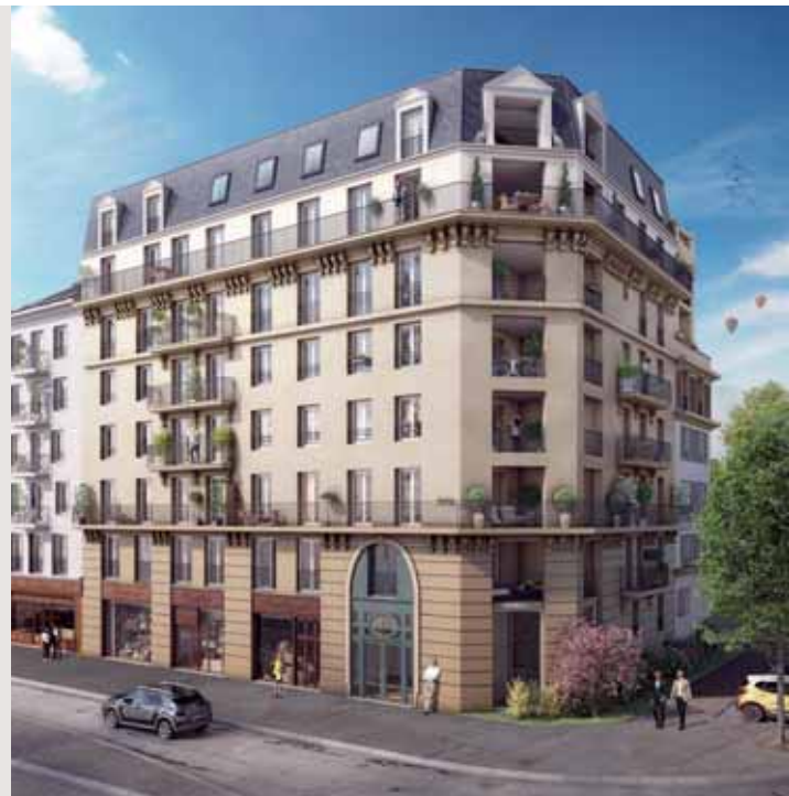
Grande Avenue, Blanc-Mesnil

Garantir le bien-vivre ensemble des copropriétaires à un coût maîtrisé . Apporter une valeur ajoutée axée sur le conseil et l'expertise.