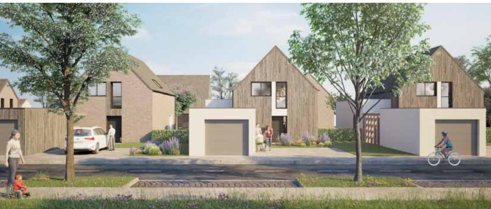
Le Clos de la Malterie, Baisieux

Notre filiale est née de la volonté du Groupe Vilogia de professionnaliser et de spécialiser les métiers de l'accession à la propriété.